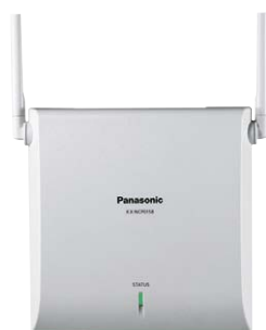
KX-NCP0158 IP-базовая микросотовая станция DECT (8 каналов)

IP базовые станции стандарта DECT подключаются к АТС непосредственно через LAN. Вы можете организовать связь со своим филиалом по IP-сети, используя базовую станцию и терминалы DECT, получив при этом доступ ко всем возможностям АТС, установленной в главном офисе.