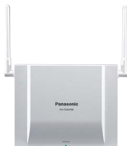
KX-TDA0156 Базовая микросотовая станция DECT (4 канала)