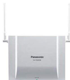
KX-TDA0158 Базовая микросотовая станция DECT (8 каналов)