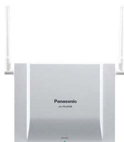
KX-TDA0155 Базовая микросотовая станция DECT (2 канала)